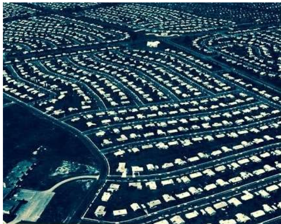
სურ. 3. ვილინგბოროს ლევიტაუნი