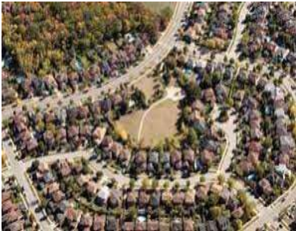
სურ.1. ლევიტაუნი - პენსილვანია