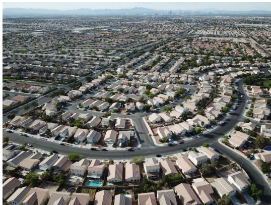
სურ. 7. Highland Hills (ჰაილენდ ჰილს)