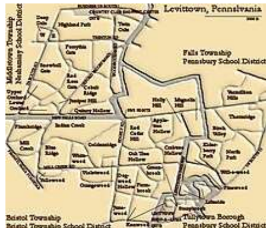
სურ. 4. ბაქსის ოლქის ლევიტაუნი

დიდი ამერიკული ქალაქების ეს გარეუბნები უზრუნველყოფდა უსაფრთხო, სუფთა, და რასობრივად სეგრეგირებულ გარემოს, რომელსაც ბევრი ამერიკელი ეძებდა. პარალელურად, ახალმა გარეუბნებმა დაიწყო ურბანული ცხოვრების ტრადიციული მახასიათებლების ეროზია. „ეკლესიები, ქალთა კლუბები, ძმური ორგანიზაციები, ტავერნები“ და პოლიტიკური კლუბები, ყველა დაზარალდა. დისტანციები აშორებდა ადამიანებს ერთმანეთისგან, რადგანაც სამსახური და სახლი ორ სხვადასხვა ადგილას იყო განთავსებული. გარკვეულ სფეროებში ტრადიციული ურბანული ფუნქციების შელახვის გარდა, გარეუბნებში გადასვლამ გაზარდა რასობრივი სეგრეგაცია.