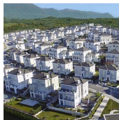
სურ. 8. Rolling Hills (როლინგ ჰილს)

შემღებელი შინამეურნეობების გადაადგილებამ გარეუბნებში, ეკონომიკური და დემოგრაფიული კრიზისი შექმნა ქალაქების ცენტრებში. წარმოიშვა განსახლების კონტრასტული ნიმუშები. გარეუბნებში დომინირებდა შედარებით მდიდარი, ძირითადად თეთრი მოსახლეობა, ხოლო ქალაქებში დაბალშემოსავლიანი და ღარიბი მოსახლეობა, მათ შორის ემიგრანტებიც. ურბანულმა ცენტრებმა მიიღეს მიტოვებული შენობები, გაზრდილი კრიმინალი, უძრავ ქონებაზე ფასების დაცემა და ეკონომიკური აქტივობის შემცირება.