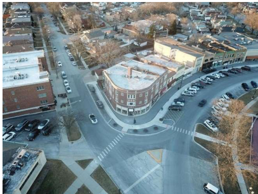
სურ. 5. Elmwood Park (ელმვუდ პარკი)

დამოკიდებულება კერძო ტრანსპორტზე. ამ უკანასკნელმა კი გამონაბოლქვის გაზრდით, უარყოფითი გავლენა მოახდინა როგორ ურბანული, ისე სუბურბანული გარემოს ლანდშაფტზე [11].